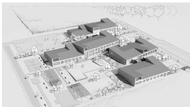
Zespół Placówek Oświatowych w Czernichowie