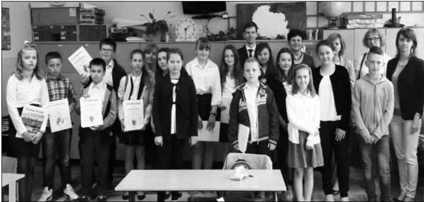
Uczniowie z Zespołu Placówek Oświatowych w Wołowicach pogłębiali wiedzę a temat Jana Pawła II.

2 czerwca odbył się etap gminny siódmej już edycji Konkursu o św. Janie Pawle II.