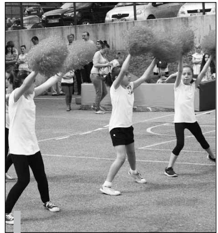
5 czerwca br. w ZPO w Czernichowie odbyła się uroczystość z okazji święta szkoły.

Dodatkowo przez cały czas trwania uroczystości odbywały się: sprzedaż książek oraz sadzonek przygotowanych przez uczniów, loteria fantowa i wystawa prac plastycznych uczniów. Najmłodszy mogli poskakać na trampolinie, a spragnieni i głodni – posilić się specjałami z grilla lub kawiarenki. Impreza była udana, mamy więc nadzieję