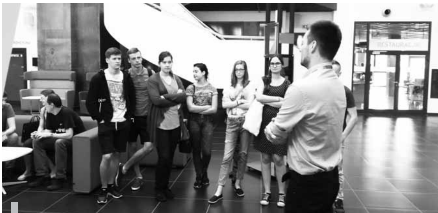
W ramach projektu „Rozwiń Skrzydła Przedsiębiorczości” uczniowie uczestniczyli w wycieczce do Krakowskiego Parku Technologicznego.

Wszyscy mieli okazję zwiedzić Krakowski Park Technologiczny i poznać zasady działalności tej instytucji, zobaczyć laboratoria