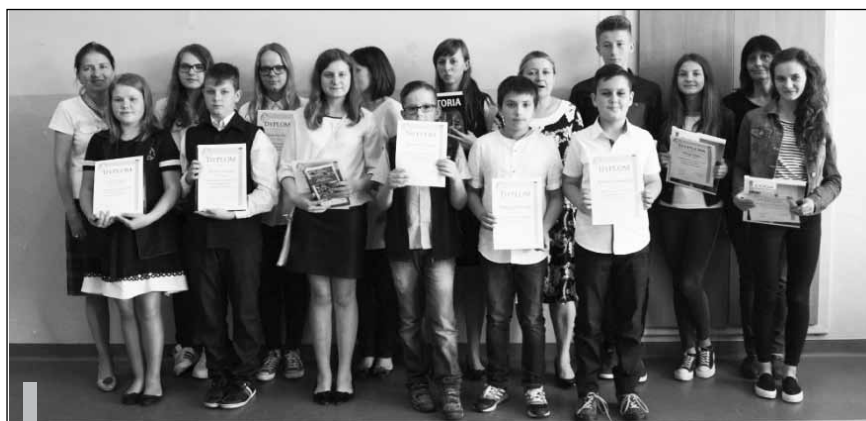
W konkursie wiedzy o życiu T. Kościuszki wzięli udział uczniowie z Ryczowa i Czernichowa.