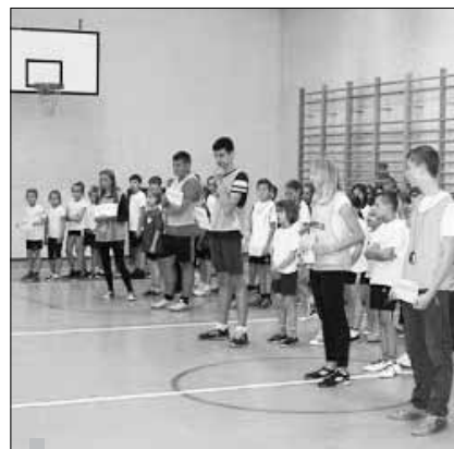
W konkurencjach zorganizowanych w ramach „Igrzysk Dzieciaka” wzięły udział 6-osobowe drużyny klasowe.