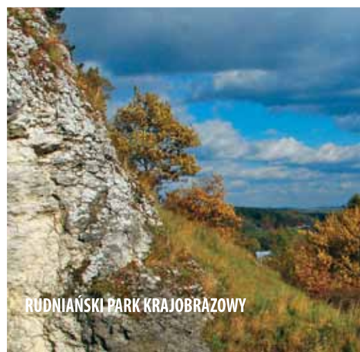
RUDNIAŃSKI PARK KRAJOBRAZOWY