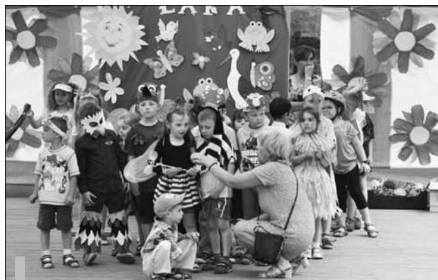
Uczestnicy pikniku obejrzeli m.in. występy dzieci oraz pokaz karate.