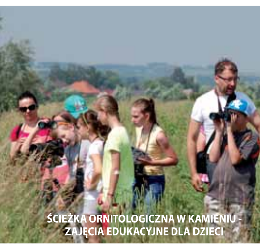
ŚCIEŻKA ORNITOLOGICZNA W KAMIENIU - ZAJĘCIA EDUKACYJNE DLA DZIECI