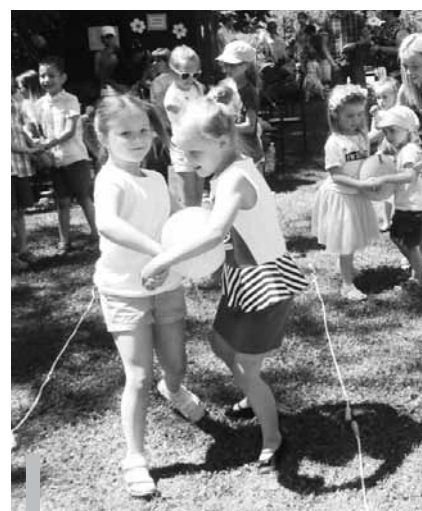
Organizatorzy pikniku zaprosili uczestników do udziału w różnorodnych konkurencjach.

ły się w przygotowanie tegorocznego pikniku organizatorzy składają gorące podziękowania!