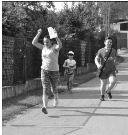
Rodziny podchody w Rusocicach były okazją do zdrowej sportowej rywalizacji, ale też do spędzenia czasu z bliskimi i znajomymi.

Zmęczenie, trud walki, nieznaną drogę, trud przebiegu trasy, intelektualne zagadki, niespodziewane zadania i sytuacje – z tym wszystkim musieli się zmierzyć uczestnicy drugich już Rodziny Podchodów w Rusocicach. Jak jednak wszyscy podkreślają, to przede wszystkim dobra zabawa i radość ze wspólnie spędzonego czasu z bliskimi i znajomymi.