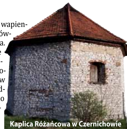
Kaplica Różańcowa w Czernichowie