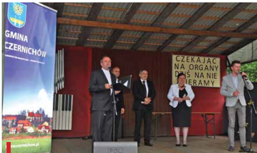
Była to już szósta edycja Festynu Parafialnego.

Przed publicznością swoje talenty pokazała także uczniowie ze Szkoły Podstawowej w Nowej Wsi Szlacheckiej, Publicznej Szkoły Podstawowej w Kłokocznynie, Ze-