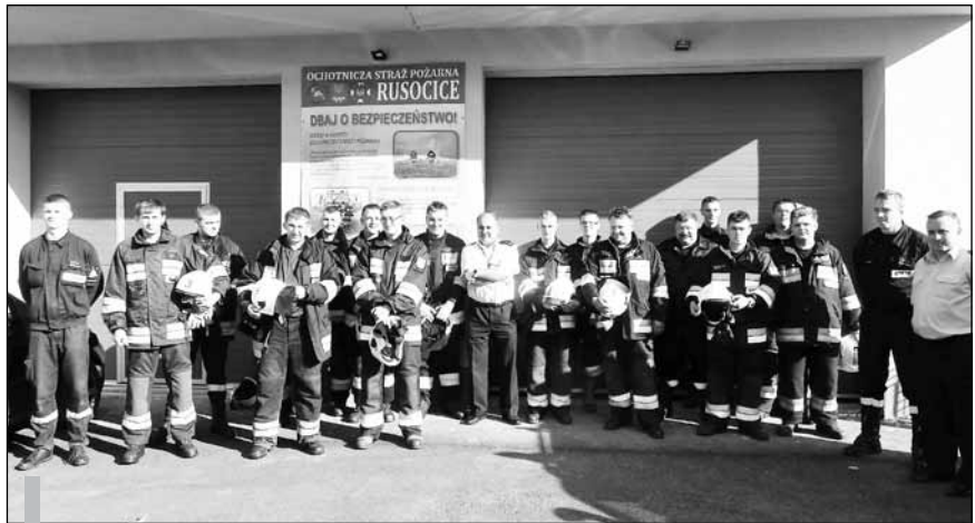
Wszyscy druhowie zdali egzamin kończący szkolenie z ratownictwa technicznego.