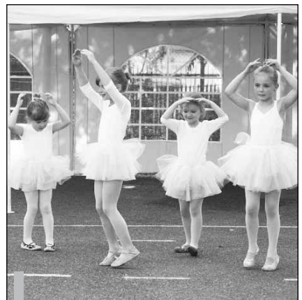
Najmłodszy prezentowali swoje talenty.

na powtórkę w przyszłym roku. Aleksandra Przebinda