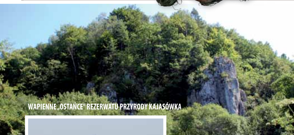
WAPIENNE „OSTAŃCE” REZERWATU PRZYRODY KAJASÓWKA