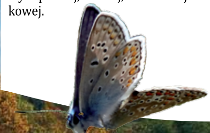
MODRASZEK „TELEJUS” GATUNEK ŚCIŚLE CHRONIONY WYSTĘPUJĄCY NA OBSZARZE OBJĘTYM NATURĄ 2000

Gmina Czernichów odznacza się także niezwykłym bogactwem świata przyrody. Spore fragmenty gminy znajdują się na terenie dwóch parków krajobrazowych – Rudniańskiego i Bielańsko-Tynieckiego. Dużą atrakcją turystyczną jest także utworzony w 1962 roku rezerwat przyrody nieożywionej „Kajasówka”. Na terenie rezerwatu wyznaczona jest ścieżka dydaktyczna przedstawiająca najbardziej charakterystyczne elementy budowy geologicznej wraz z elementami przyrody nieożywionej. W północnej części gminy znajdują się dwa Obszary Natura 2000. Zarówno położenie jak i przyroda sprzyjają rozwojowi rekreacji i turystyki pieszej, konnej, rowerowej i kajakowej.