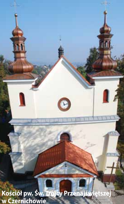
Kościół pw. Św. Trójcy Przenajświętszej w Czernichowie