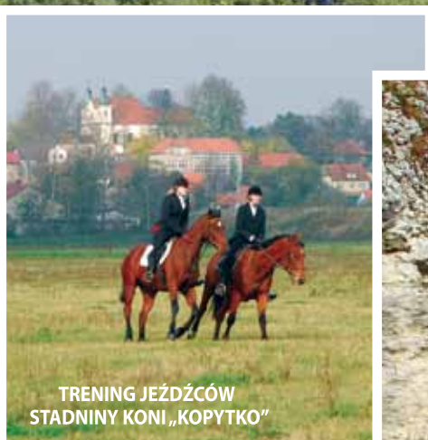
TRENING JEŹDZCÓW STADNINY KONI „KOPYTKO”