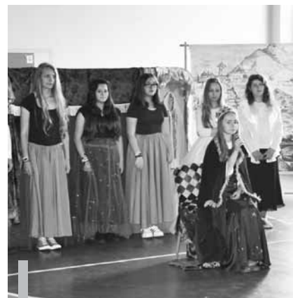
Dzień Patrona – Królowej Jadwigi w Zespole Placówek Oświatowych w Rybnej.