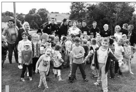
Roześmiany pochód przeszedł przez Przeginię Duchowną.