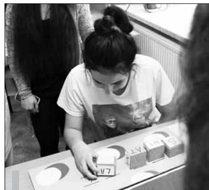
W Zespole Szkół Rolnicze Centrum Kształcenia Ustawicznego w Czernichowie odbyła się wystawa interaktywna „Witamy w nanoświecie”.

Na wytrwałych czekały jeszcze dwa ekspozyty – nanodomino i nanokostki, zaprojektowane przez uczniów w ubiegłorocznej edycji projektu. Ich bliźniacze modele można oglądać do końca lipca na wystawie „Witamy w nanoświecie” w Muzeum Collegium Maius Uniwersytetu Jagielloń-