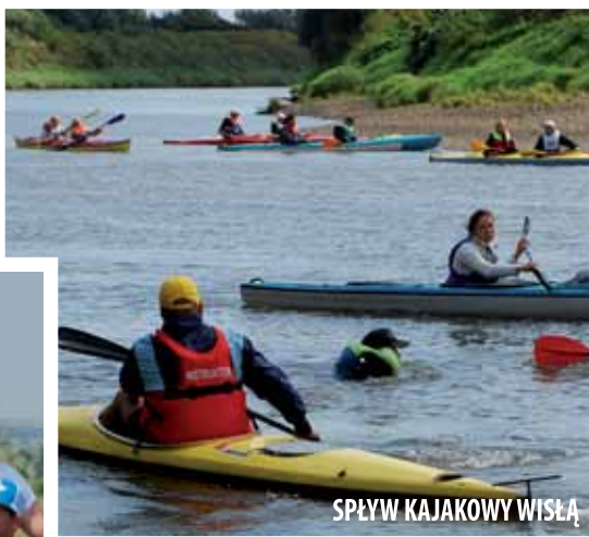
SPŁYW KAJAKOWY WISŁĄ

Miłośnicy ornitologii znajdą dla siebie w Kamieniu atrakcję w postaci ścieżki ornitologicznej Łączany. Zbiornik w Łączanach jest największym zimowiskiem ptaków na górnej Wiśle, a w okresie przelotów wiosennych i jesiennych ważnym miejscem postojowym dla ptaków migrujących. Znajdują się tu cztery stanowiska obserwacyjne, ławki i tablice informacyjne. W urzędzie gminy można wypożyczyć lornetki do obserwacji ptaków. Zapraszamy wszystkich miłośników ciszy, przyrody i zabytków do spacerów i przejażdżek po gminie Czernichów.