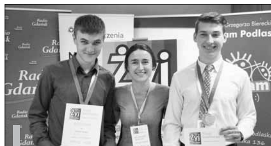
Uczniowie ZSRCKU zdobyli II i III miejsce na ogólnopolskim konkursie ekonomicznym „Żyj finansowo!”

Uczniom gratulujemy wiedzy, medali i nagród! W nowym roku szkolnym kolejni uczniowie ZSRCKU w Czernichowie będą mogli uczestniczyć w projekcie „Żyj finansowo! czyli jak zarządzać finansami w ży-