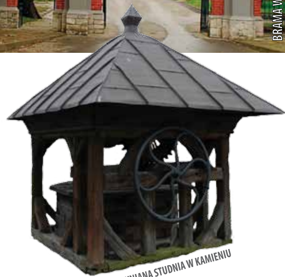
DREWNIANA STUDNIA W KAMIEŃ