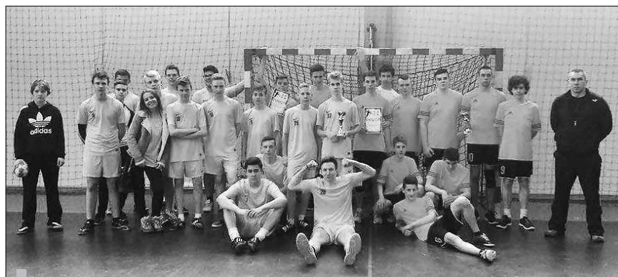
Dziewczęta i chłopcy z gimnazjum z Zespołu Placówek Oświatowych w Wołowicach reprezentowała gminę Czernichów, biorąc udział w powiatowych zawodach sportowych.

Z kolei w rozgrywkach gminnych w piłce ręcznej chłopców, które odbyły się 24 lutego 2016 r., drużyna z Wołowic zdobyła I miejsce. Dzięki temu reprezentowała ona gminę Czernichów w zawodach powiatowych, które rozegrano w Skawinie 9 marca 2016 r. Chłopcy zajęli tam II miejsce na