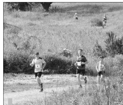
Trasa biegu wiodła przez malownicze tereny.