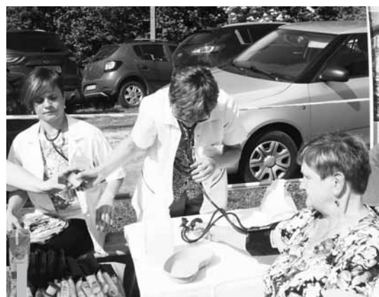
Słuchaczki kierunku opiekun osoby starszej mierzą ciśnienie tętnicze”