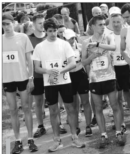
Zawodnicy na starcie.

zawody dla dzieci w kategorii kl. 1-3 oraz 4-6 szkoły podstawowej.