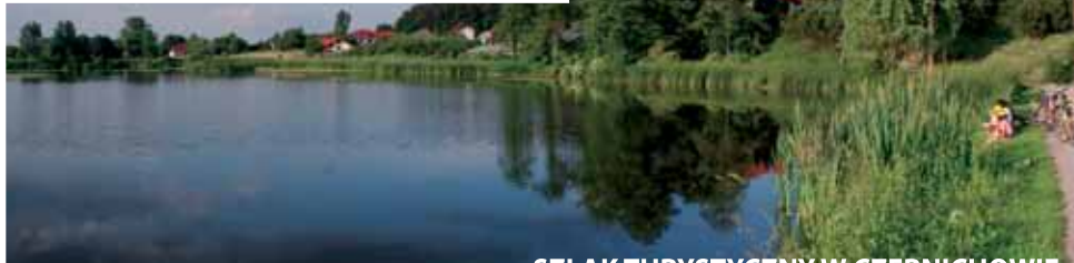
SZLAK TURYSTYCZNY W CZERNICHOWIE