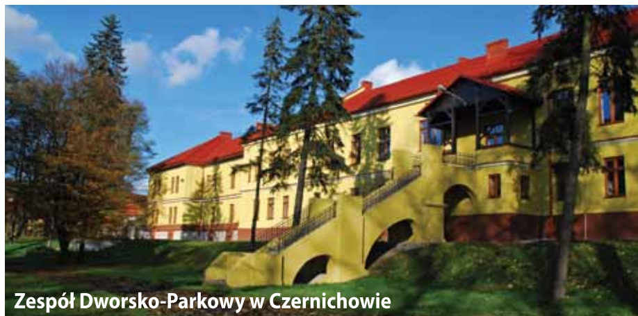
Zespół Dworsko-Parkowy w Czernichowie

S pacerując po Czernichowie należy zwrócić także uwagę na XVIII wieczny zespół dworsko-pałacowy. Składa się on z murowanych budynków gospodarczych, starej elektrowni, domu nauczyciela, parku z ogrodem użytkowym oraz budynków mieszkalnych powstałych po założeniu szkoły rolniczej. Od 20 czerwca 1860 roku do dziś funkcjonuje tu najstarsza działająca bez przerwy szkoła rolnicza w Polsce. Zespół uzupełnia niezwykle lamus z XIX w.