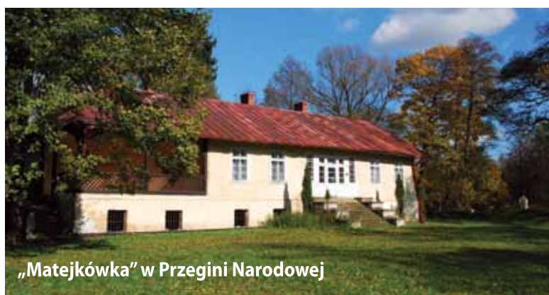
„Matejkówka” w Przegini Narodowej

W Przegini Narodowej znajduje się zespół dworsko-parkowy, który stanowi skromny drewniany dwór z XIX w. przebudowany na początku wieku XX, zwany „Matejkówką” gdyż należał kiedyś do rodziny Jana Matejki, oraz park krajobrazowy z początku XIX w. Obecnie dworek jest siedzibą lokalnego Stowarzyszenia Kobiet, kultywującego tradycję regionalną.