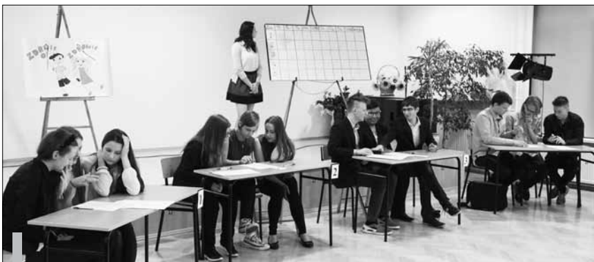
Uczestnicy konkursu w czasie turnieju wiedzy.