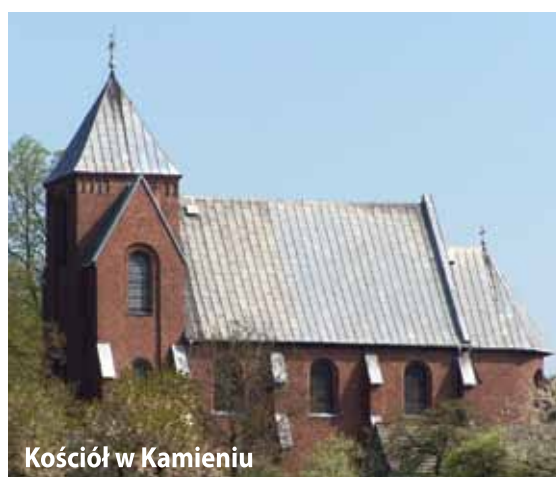
Kościół w Kamieniu

W Kamieniu naszą uwagę na pewno przyciągnie murowany kościół pod wezwaniem Opieki Matki Bożej wraz z łaskami słynącym Obrazem Matki Boskiej Opieki. Ciekawostką jest fakt, że do 1910 r. do Kamienia i cudownego obrazu odbywały się pielgrzymki. Neogotycki, murowany kościół powstał na miejscu dawnej kaplicy z XVII w. Plebania murowana z początku XX w., obiekty gospodarcze z XVIII-XIX w., w tym lamus murowany z XVII-XVIII w. Plebanię otaczają piękne kilkusetletnie lipy będące pomnikami przyrody. Na szczególną uwagę zasługuje też drewniana studnia z przełomu XVIII-XIX w., będąca okazałym dziełem techniki i ciesiołki. Warto odwiedzić utworzoną w 2001 r. staraniem Towarzystwa Przyjaciół Kamienia Izbę Regionalną. Mieści się ona pod adresem Rusocice 323 (dawny budynek ZURB) Zwiedzanie obiektu możliwe jest po wcześniejszym zgłoszeniu telefonicznym 793 635 136 lub 692 954 851