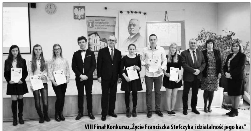
VIII Finał Konkursu „Życie Franciszka Stefczyka i działalność jego kas”