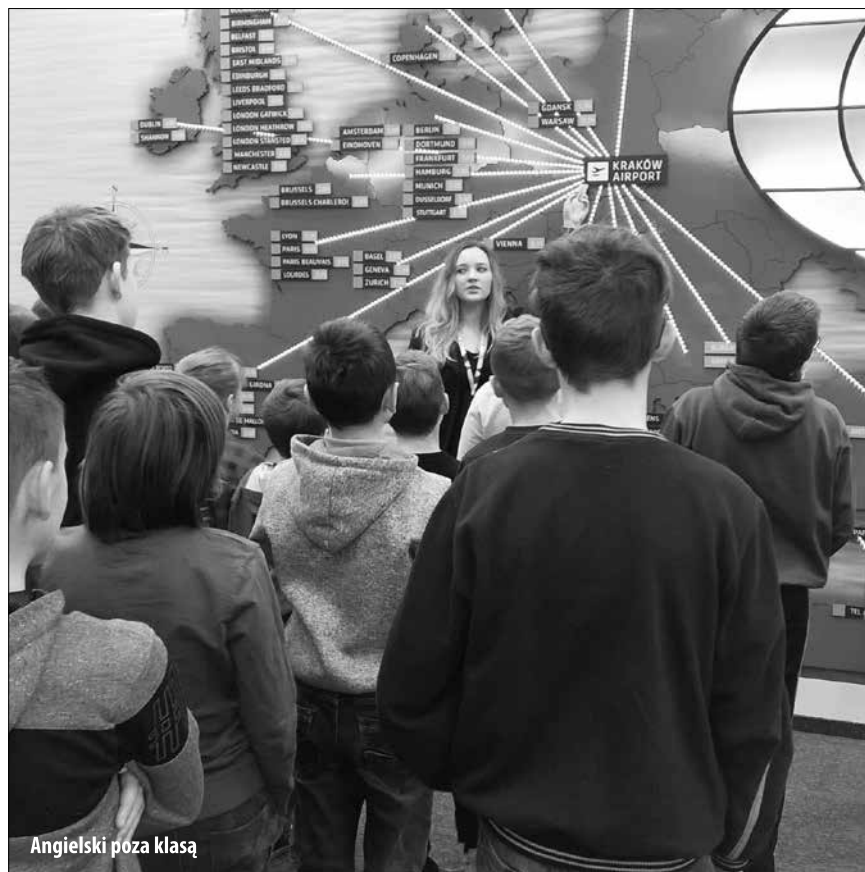
Angielski poza klasą