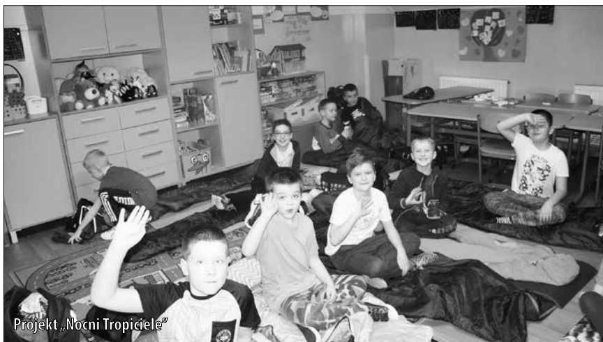
Projekt „Nocni Tropiciele”

Uczniowie klas I - III Szkoły Podstawowej w Kamieniu przystąpili do dwóch ogólnopolskich projektów eTwinning. Pierwszy z nich to projekt „Na skrzydłach bociana”, którego organizatorem jest Szkoła Podstawowa w Krośnicy. Celem projektu jest przybliżenie uczniom zwyczajów bocianów, ich symbolikę, a przede wszystkim sprawienie, aby poprzez podróże bohatera projektu uczniowie poznali ciekawe pod względem historycznym, artystycznym oraz przyrodniczym miejsca w całej Polsce. Projekt rozpoczął się na początku marca wzajemnym poznaniem się. Uczniowie mieli też możliwość wyboru imion dla bocianiej rodziny oraz zagłosowali na logo projektu. Każda placówka wybrała jedno lub dwa gniazda w najbliższej okolicy, prowadzi obserwację i dokumentację fotograficzną oraz opisową. Szkoła w Kamieniu wybrała gniazdo w Rusocicach i Łączanach. Obserwacje gniazd prowadzone są przez grupy uczniów do czasu odlotów. Projekt zostanie podsumowany we wrześniu.