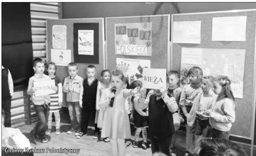
Gminny Konkurs Polonistyczny